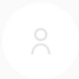
Renate Lyseng Elvsveen Kjøkken