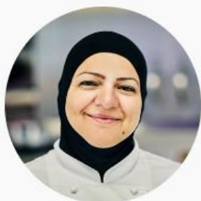
Shirin L Lolo Kjøkken og renhold